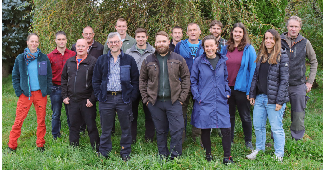
Die Mitarbeitenden der Waldabteilung Mittelland